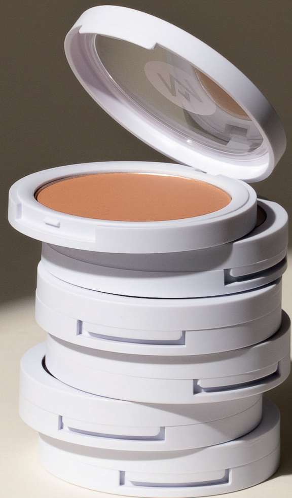
La Poudre bonne mine 26,90€ Teinte universelle

Essentielle pour apporter un coup d'éclat en toute saison, la Poudre bonne mine de MÈME réchauffe le teint des peaux sensibles avec ses 100% d'ingrédients d'origine naturelle et sa teinte universelle modulable. Idéale pour un effet retour de vacances tout en restant à l'abri des dangers des UV !